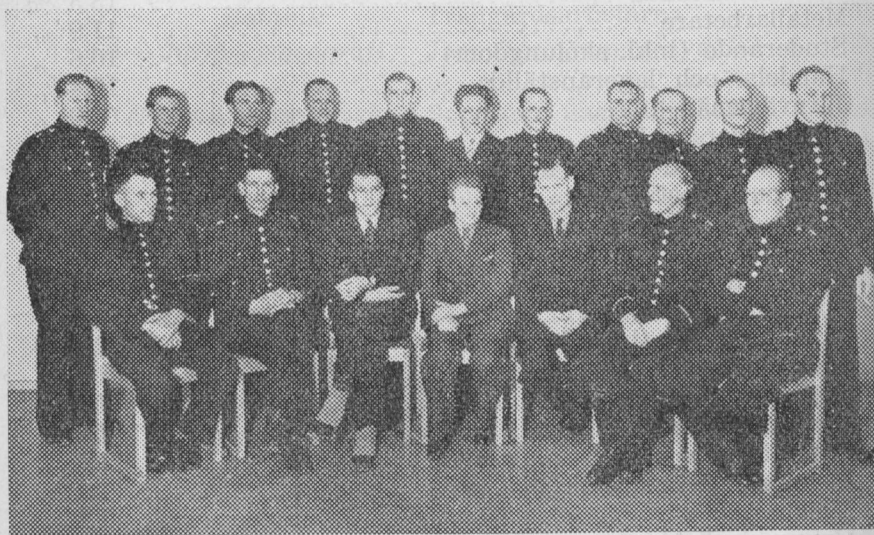
Medl. i Brandmännens studiecirklar.