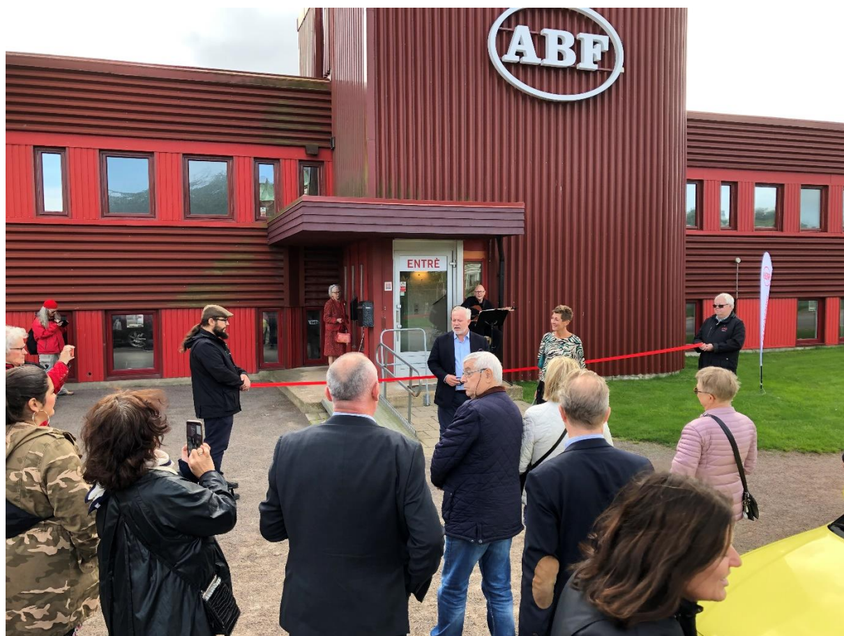
Fotot togs vid invigningen av ABF-huset Java september 2019